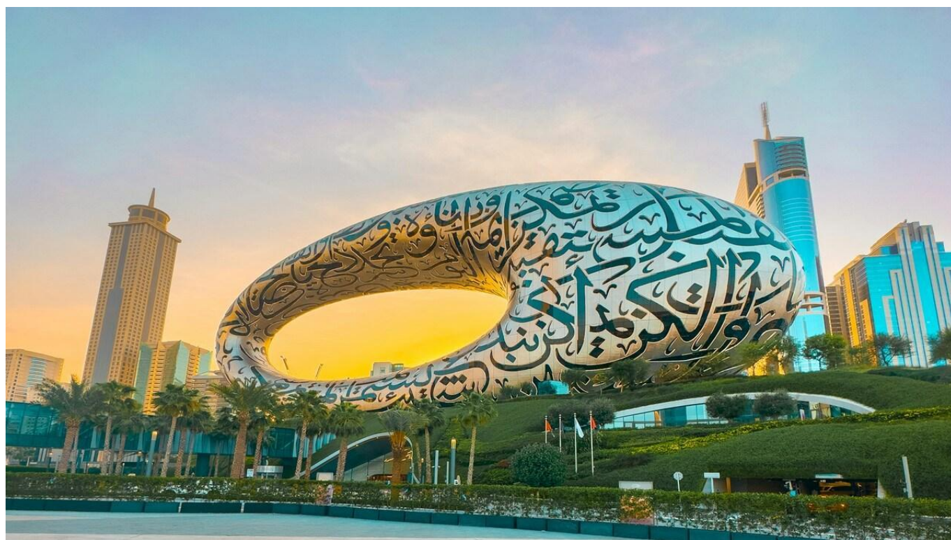
Посещение на Музея на Бъдещето ОБЕДИНЕНИ АРАБСКИ ЕМИРСТВА, ДУБАЙ

Вечеря; Напитки; Екскурзоводско обслужване; Транспорт