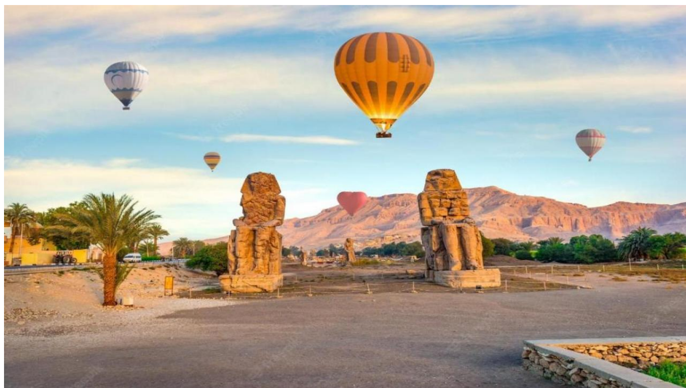
Полет с балон над Луксор