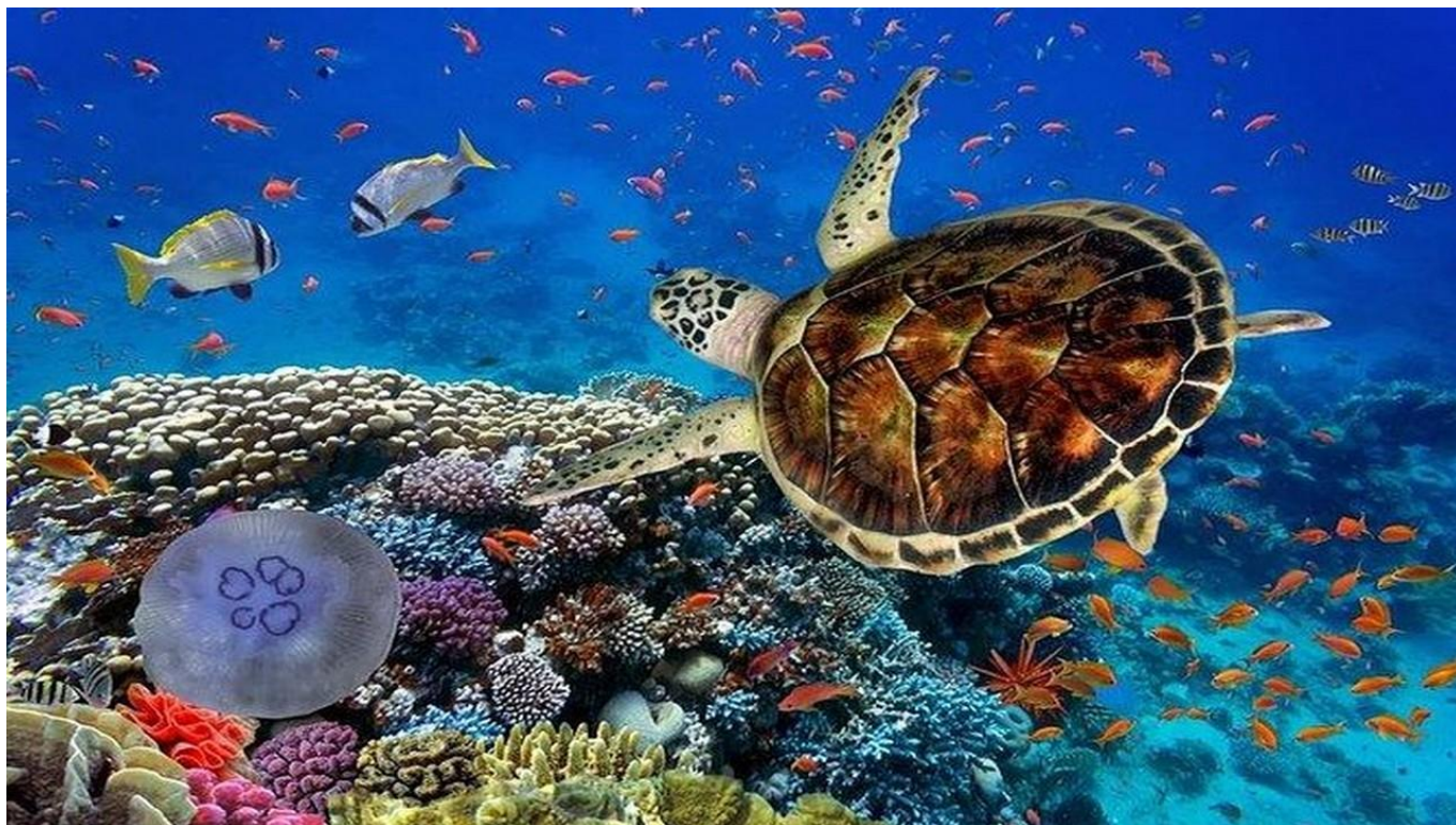
Шнорхелинг в красивите рифове на Satayeh ЕГИПЕТ,ЕГИПЕТ