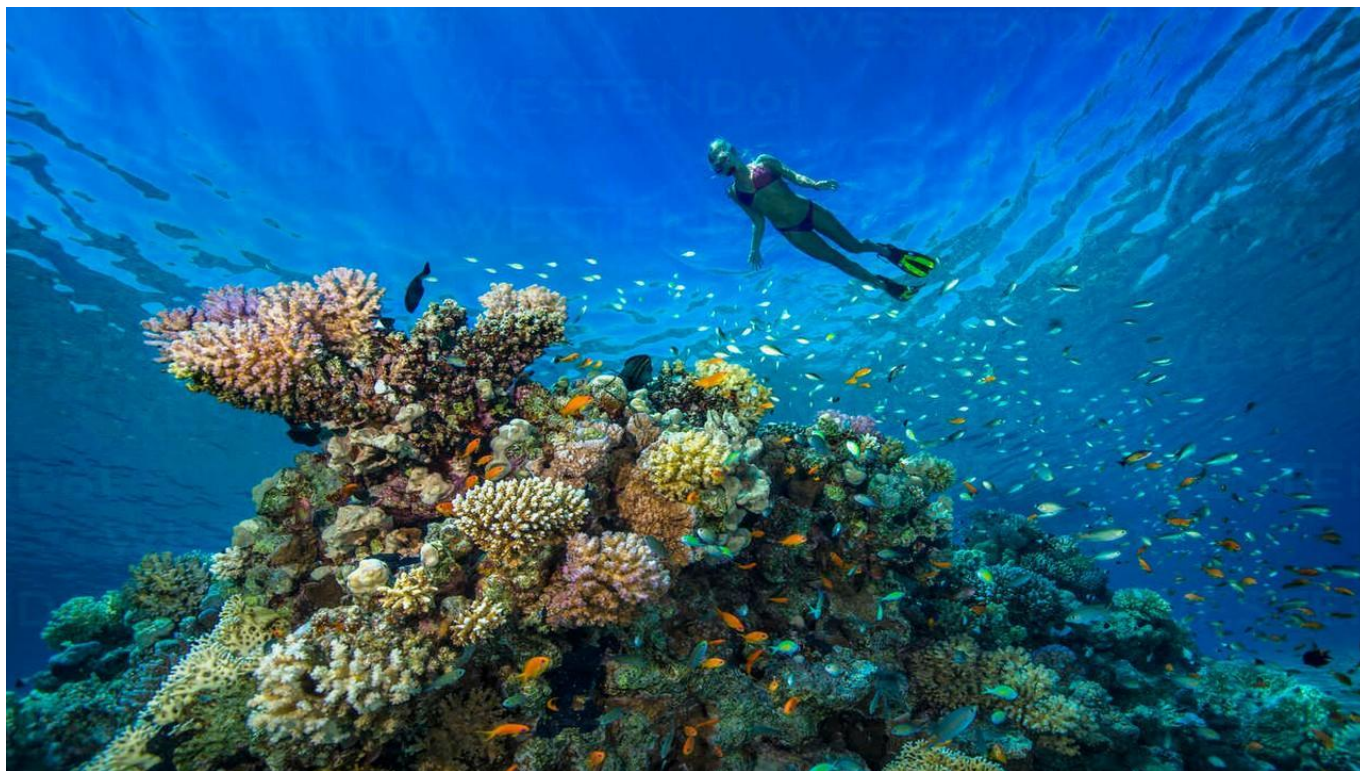
Шнорхелинг в красивите рифове на Namata ЕГИПЕТ,ЕГИПЕТ