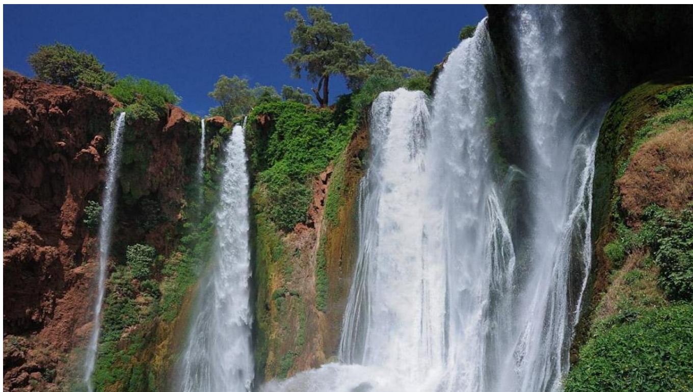
Екскурзия до Водопадите Узуд