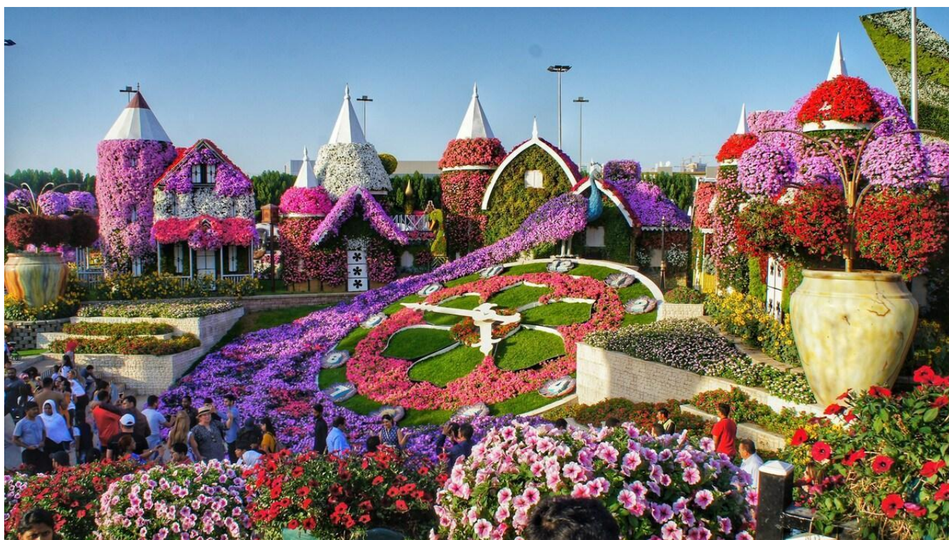
Посещение на Градините на Чудесата и панаирното селце Global Village

Входни такси за Dubai Frame; Екскурзоводско обслужване; Транспорт