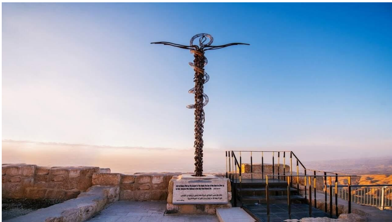
Планината Небо ЙОРДАНИЯ, ЙОРДАНИЯ Включено в цената

Планината Небо е едно от най-свещените и вдъхновяващи места в Йордания. Според библейското предание именно оттук пророкът Мойсей за първи път съзира Обетованата земя - след дълги 40 години странстване с израилтяните из пустинята - и тук завършва земният му път.