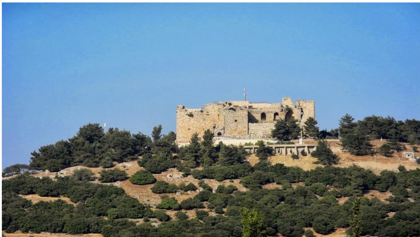
Замъкът Ажлун (Калат Ар-Рабат) ЙОРДАНИЯ, ЙОРДАНИЯ Включено в цената

Посещението на замъка Ажлун предлага вълнуващо пътуване назад във времето, към епохата на кръстоносните походи и арабската военна мощ. Разположен високо на хълм сред зелените гори на северна Йордания, този внушителен каменен форт е построен през 1184 г. от един от пълководците на легендарния Саладин - великия мюсюлмански лидер, победил кръстоносците.