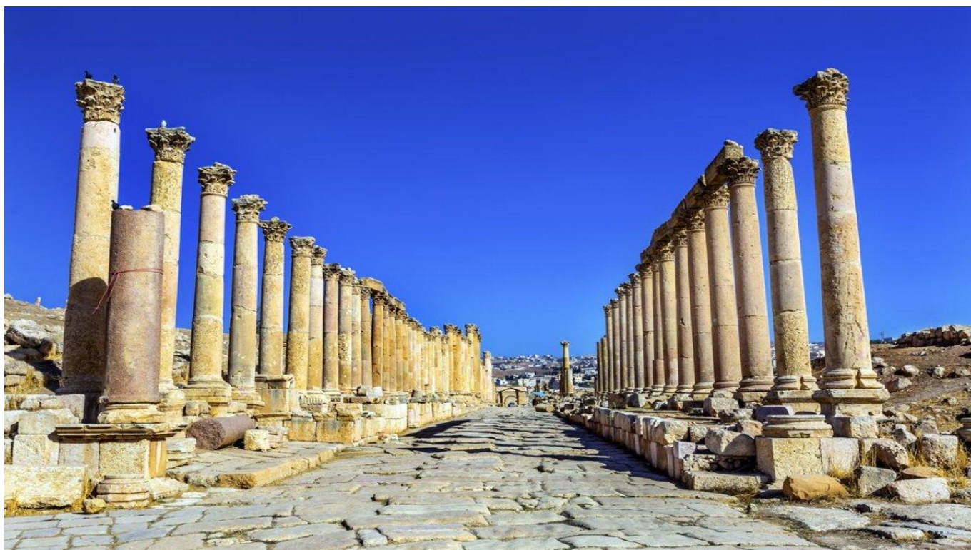
Обиколка на Древния римски град Джераш ЙОРДАНИЯ, ЙОРДАНИЯ Включено в цената

Джераш - едно от най-впечатляващите археологически чудеса на Близкия изток - ви пренася директно в златната епоха на Римската империя. Наричан още „Помпей на Изтока“, този древен град е забележително добре запазен, със своите монументални руини, които разкриват величието и реда на римското градоустройство.