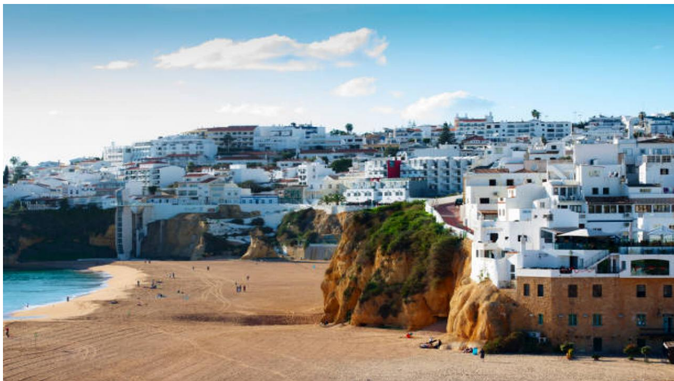
Посещение на Фаро - вкл. ИСПАНИЯ,ИСПАНИЯ (EU)