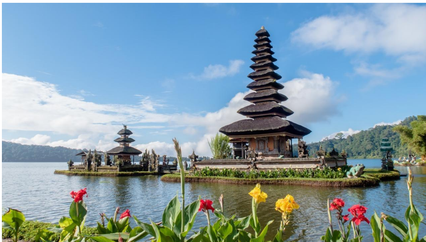
Посещение на храма Улун Дану ИНДОНЕЗИЯ,БАЛИ